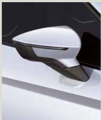
NEVADA WHITE 2