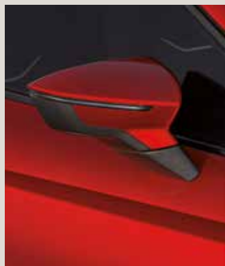
DESIRE RED 2