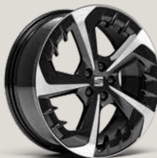
PERFORMANCE 18" MASKINBEARBETADE LÄTTMETALLFÄLGAR, BLACK R PUK