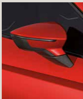
PURE RED 1