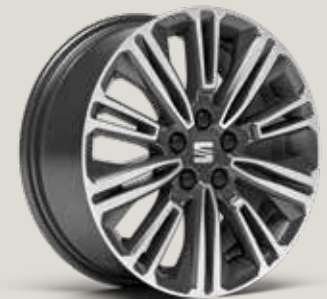
DESIGN 16" MASKINBEARBETADE LÄTTMETA- LLFÄLGAR, NUCLEAR GREY PJP