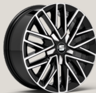
DYNAMIC 17" MASKINBEARBETADE LÄTTMETALLFÄLGAR, BLACK RSK