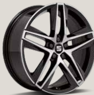
PERFORMANCE 18" MASKINBEARBETADE LÄTTMETALLFÄLGAR, GLOSSY BLACK PUL