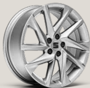
DYNAMIC 17" LÄTTMETALLFÄLGAR, BRILLIANT SILVER