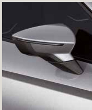
URBAN SILVER 2