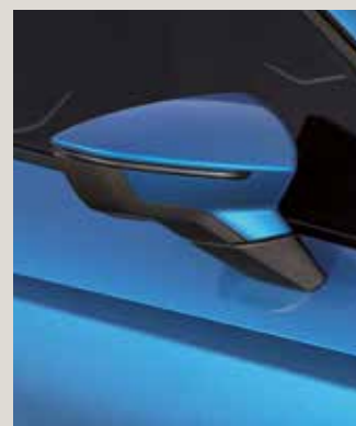
SAPPHIRE BLUE 2