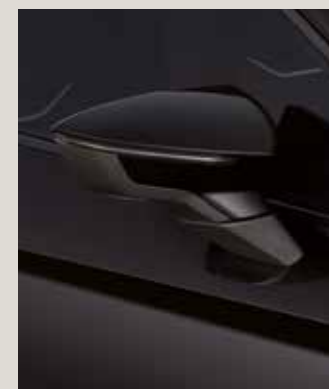
MIDNIGHT BLACK 2