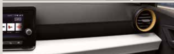
COMO TYG KOMFORTSÄTEN