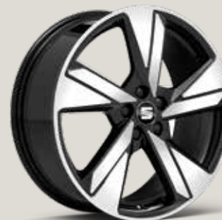
PERFORMANCE 18" MASKINBEARBETADE LÄTTMETALLFÄLGAR, BLACK RSL