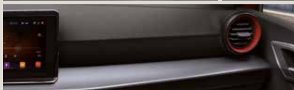
LE MANS TYG SPORTSTOLAR