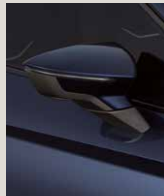
ASPHALT BLUE 2