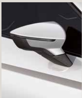
CANDY WHITE 1