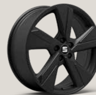
PERFORMANCE 18" LÄTTMETALLFÄLGAR, SPORT BLACK RSU