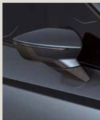
MAGNETIC TECH 2